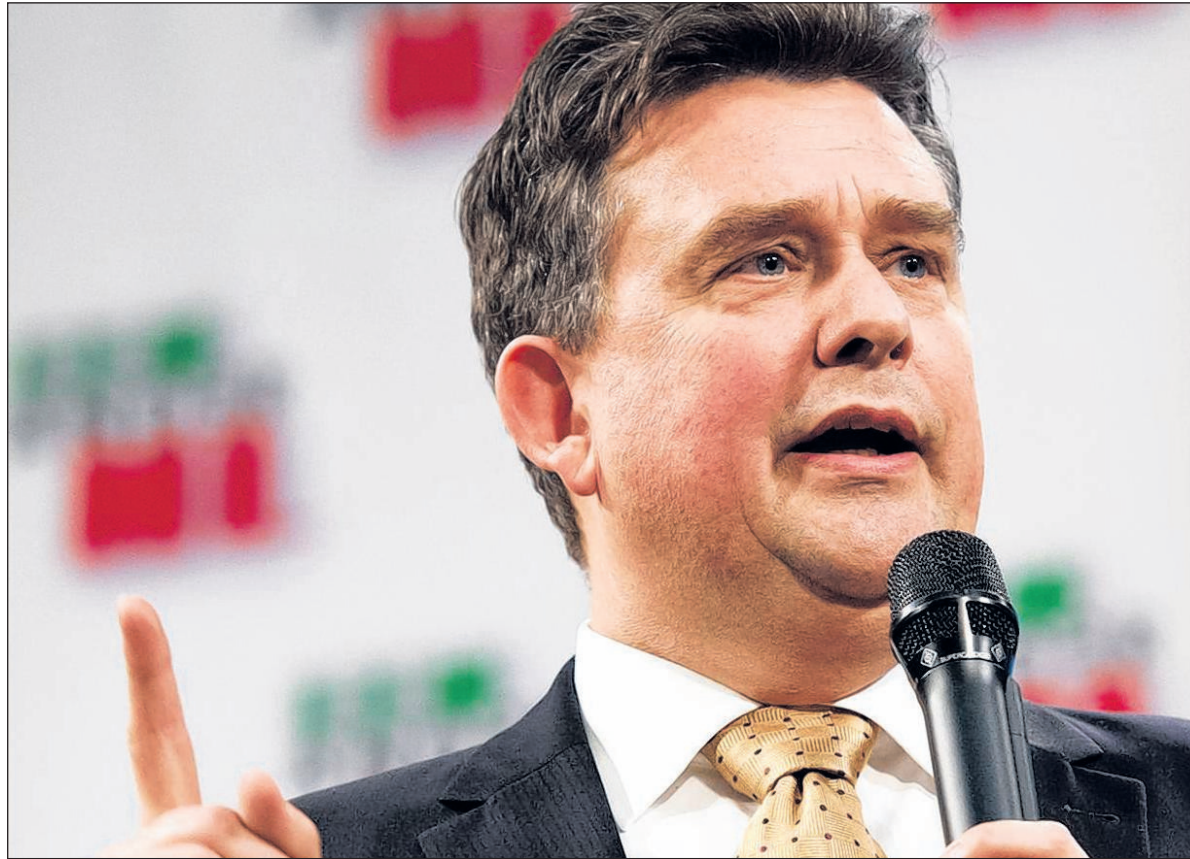
SP-leider Roemer ligt zeer goed bij de kiezers.